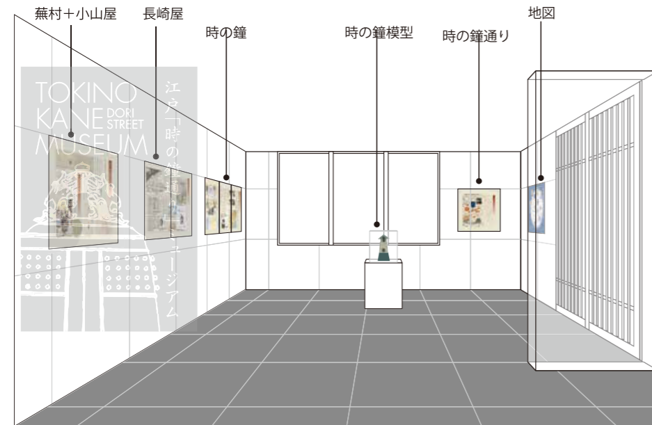
展示コーナーパース

日本橋の「ホテルかずさや」の創業 130 周年を記念した展示コーナー、屋外看板などを制作。 ホテル前の「時の鐘通り」にちなんだ展示物を制作。