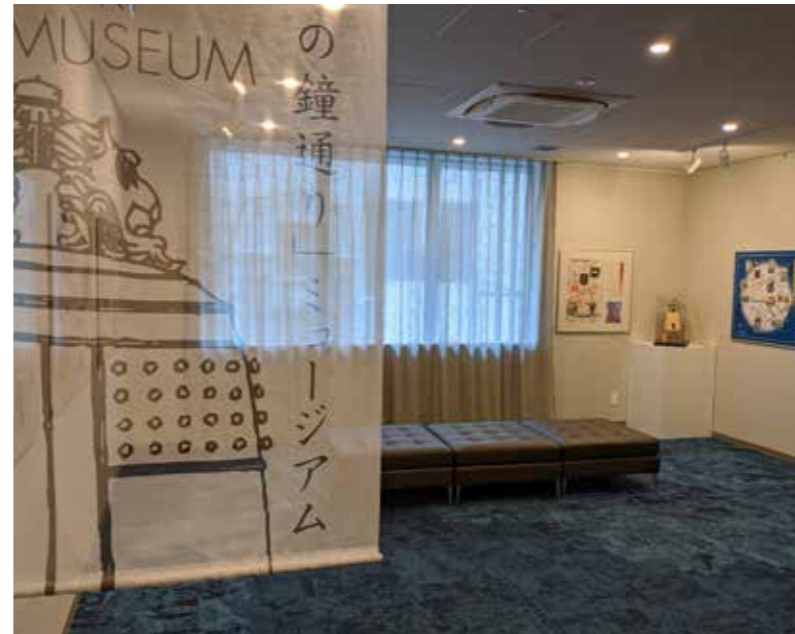
展示コーナー入り口