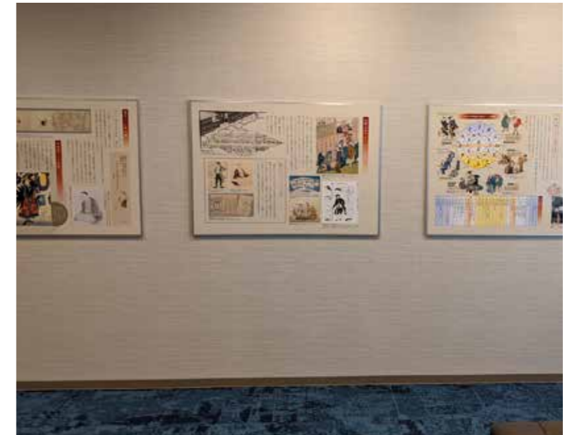
展示コーナー壁面パネル